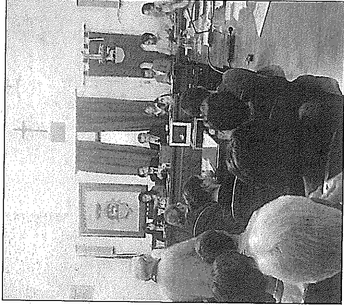
Terremoto politico L'opposizione all'attacco del sindaco