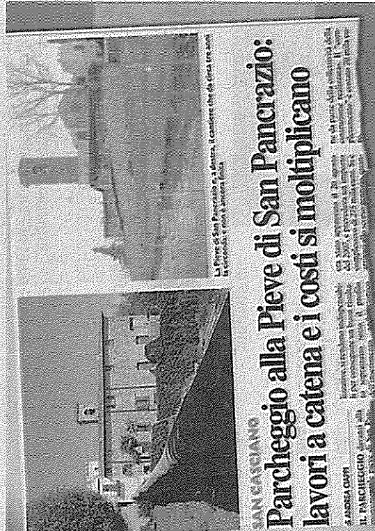
SAN CASCIANO Parcheggio alla Pieve di San Pancrazio: lavori a catena e i costi si moltiplicano

VIA LE MACCHINE dalla piazza davanti alla pieve preromantica di San Pancrazio, un monumento del X secolo. Ma il rimedio, per come s'erano messe le cose, rischiava di essere peggio del male. Il Comune ha rimediato in corsa, ed il parcheggio - con opportune rifiniture in pietra per arginare l'impatto architettonico - è "prossimo alla conclusione". Che significa la giunta Pescini. Che appun-